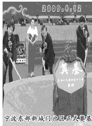
宁波东部新城门户区正式奠基