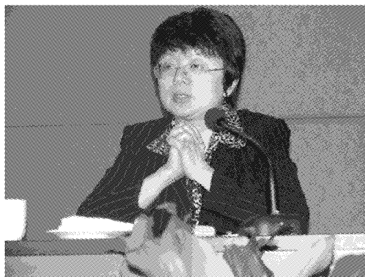
市委副秘书长、市直机关工委书记 唐志一