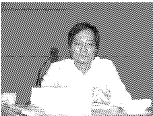
市发改委副主任 詹荣胜