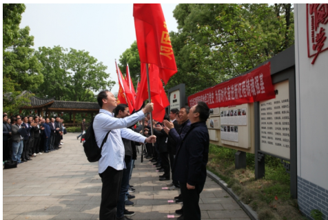
“重走领袖路、担当再出发” 宁波举行“百团千人”三服务授旗仪式

（二）守正创新，载体推动“促”担当。依托党员上讲台等平台，大力营造担当实干的良好氛围。结合机构改革推进会，开展了“新岗位、新作为”处长谈担当活动。结合贯彻十九届四中全会精神，组织开展了“守初心·担使命，做‘一懂两爱’好干部”电视党课竞赛。结合“重要窗口”大讨论开展了“不负韶华、奋勇担当”三农论“谈”竞讲活动。结合党史学习教育开展了“重走领袖路、担当再出发”活动，并举办青春、奋斗、担当、三农“四个之我”主题竞讲活动。同时，还通过田头党课、“书香稻香写担当”活动、清廉农业漫画展等方式，进一步凝聚担当共识，汇聚奋进力量。