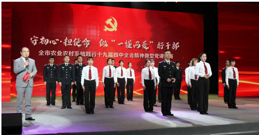
守初心·担使命 做“一懂两爱”好干部 ——全市农业农村系统践行十九届四中全会精神微型党课竞赛

（三）深研细琢，制定标准“释”担当。注重引导党员干部在学中思、议中悟，在学习贯彻习近平总书记在浙江考察调研时重要讲话