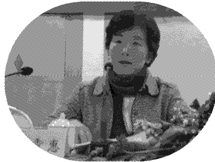
市纪委副书记王霞惠讲话